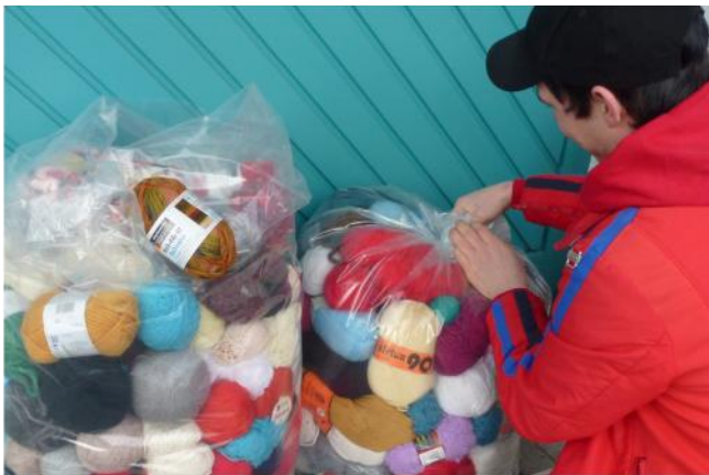
Wolle und Garn für Flüchtlingsprojekt in Berlin.