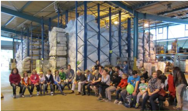
Tag des offenen Gewerbes, Juli 2014

Wir sind stolz auf unseren „gläsernen Sortierbetrieb vor den Toren der Hauptstadt“. Immer wieder kommen Gruppen zu uns, um an Führungen teilzunehmen. Die Besichtigungen sind für alle Altersgruppen geeignet.