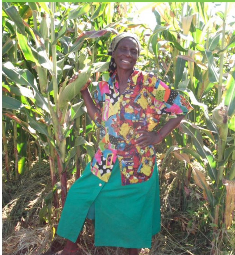
Stolze Bäuerin. Projekt Farmers' Clubs, Makoni, Simbabwe

2014-2015 haben wir zum einen dieses Projekt für 1.200 Kleinbauern in Simbabwe unterstützt. Zum anderen leisten wir Zahlungen an die Föderation HPP. Weltweit gab es 2014 rund 800 HPP Projekte, in denen sich mehr als 13 Millionen Menschen für eine Verbesserung ihrer Lebensverhältnisse einsetzten.