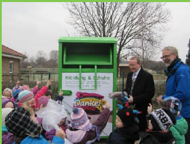
Impressionen aus der Sammlung, 2014 und 2015