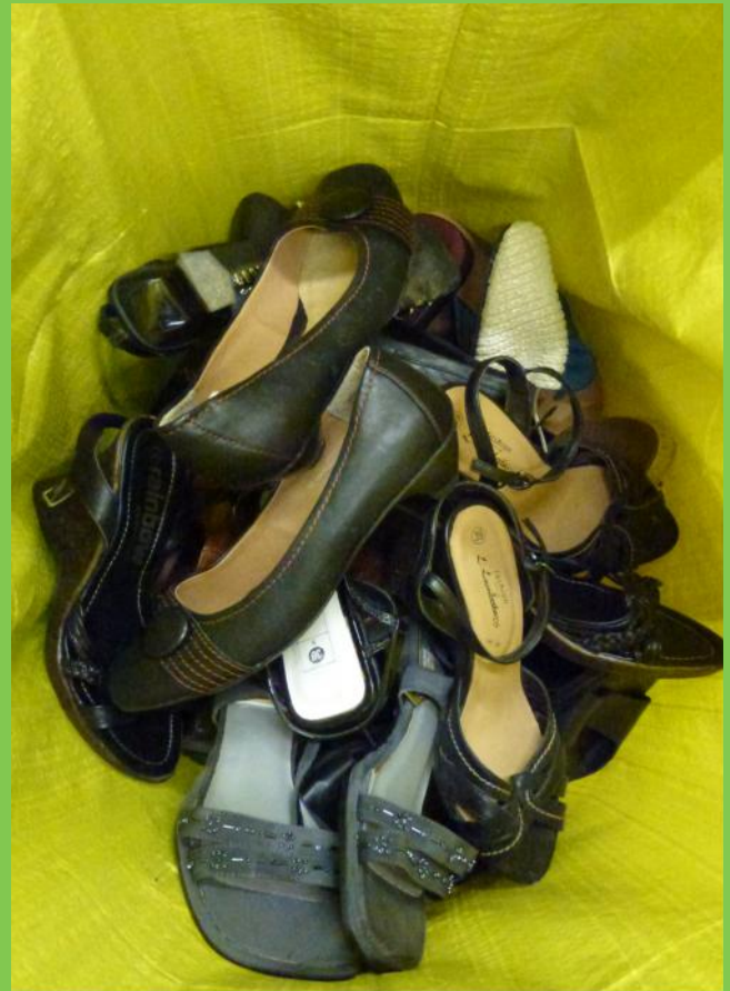
Eine von vielen Kategorien: Schuhe Laden Sommer.

Unsere Sortierung richtet sich nach den Bedürfnissen in den Empfängerländern - in Deutschland, Mosambik, Albanien, etc. Die Kleidung wird verkauft. Ein Beitrag zur Grundversorgung vieler Menschen. Damit schonen wir außerdem die Umwelt, schaffen Arbeitsplätze und erwirtschaften Überschüsse für Entwicklungsprojekte.